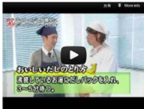
2012年4月3日 ケーブルテレビ・スターキャット『天ちゃんアワー どえりゃ〜ナゴヤ』にて節辰商店が52分間特集されました。