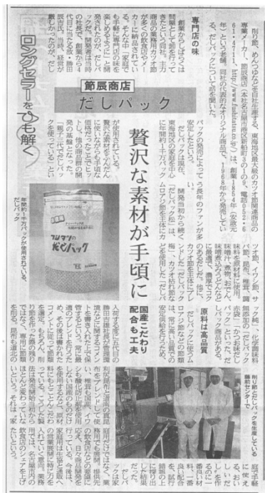
2011年12月27日 中部経済新聞「ロングセラーをひも解く」に弊社のだしパックが「40年のロングセラー商品」として紹介されました。